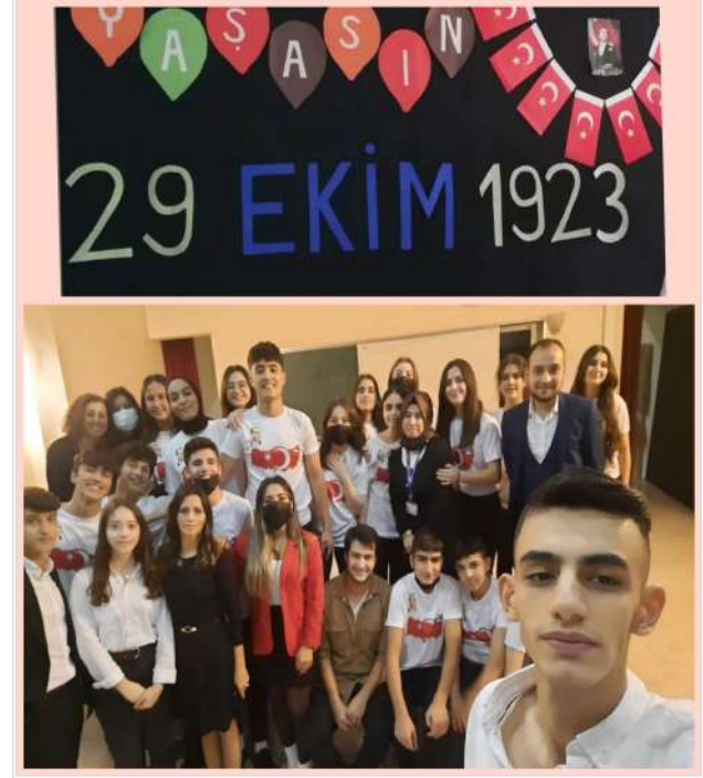
29 Ekim Cumhuriyet Bayramı Kapsamında okulumuzda gerçekleştirilen sergi ve gösteriler